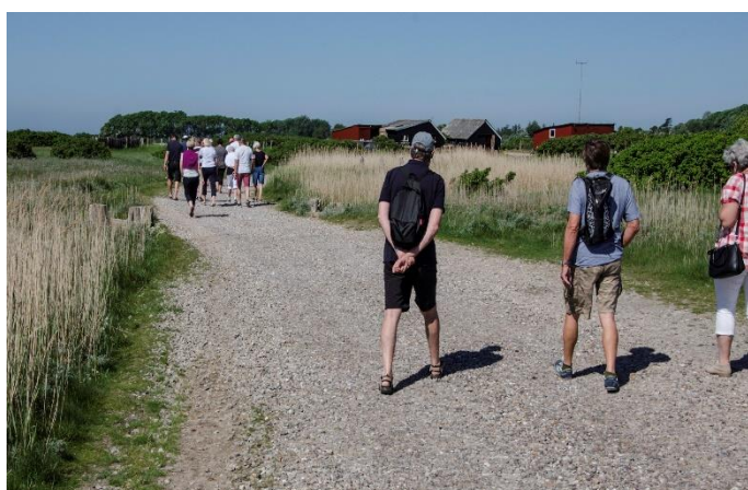
Landgang på Thorø

Blue Bird). De sejlene var ankommet i løbet af fredagen, mens de kørende kom til morgenkaffen lørdag.