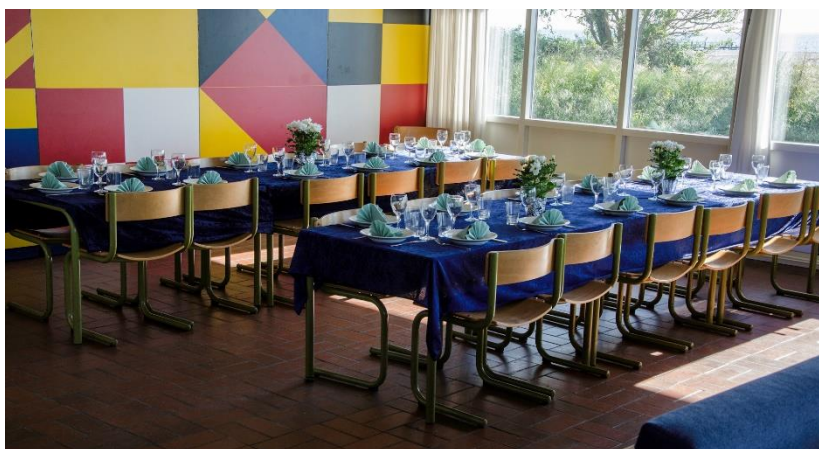
Klar til festmiddag

Derefter var der tid til hygge og til at nyde udsigten over Lillebælt med Bågå.