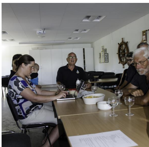
Dirigenten (Janus) i funktion