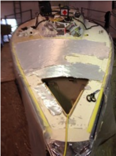
De steder hvor gelcoaten og det øverste lag glasfinder manglede, blev forstærket med et lag speciel glasfiberdug og epoxy.