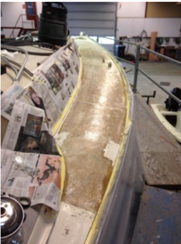
Overfladen blev slebet og spartlet med epoxy tilsat en fortykkelsesmiddel.